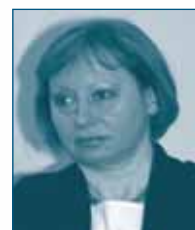
Г-жа Ольгица СПЕВЕЦ Конкурентное Ведомство Хорватии Хорватия