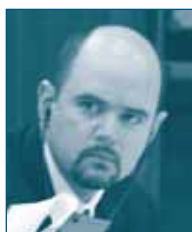
Г-н Николас А. ВИДНЕЛЛ Федеральная Комиссия по Торговле США