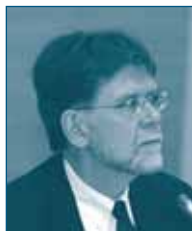
Г-н Вилльям Е. КОВЭСИК Федеральная Комиссия по Торговле США