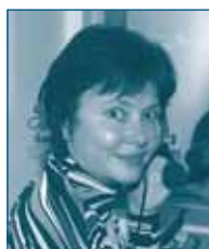
Г-жа Татьяна ВЕНЕДИКТОВА