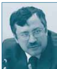
Г-н Андрей ЦАРИКОВСКИЙ Федеральная Антимонопольная Служба Российская Федерация