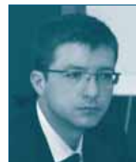
Г-н Гергели ДОБОШ Совет по Конкуренции Венгерское Конкурентное Ведомство