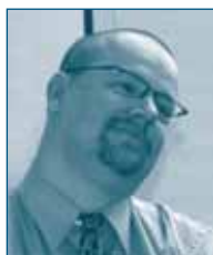
Г-н Даг ЙОХАНССОН Генеральный Директорат по Конкуренции Европейская Комиссия