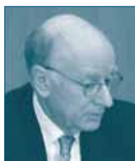
Г-н Бернارد Дж. ФИЛЛИПС Конкурентное Подразделение ОЭСР