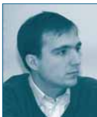
Г-н Тьерри БЕРАНЖЕ Генеральный Директорат по Конкуренции Европейская Комиссия