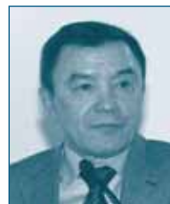
Г-н Мажит ЕСЕНБАЕВ Агентство по защите конкуренции Республики Казахстан Республика Казахстан