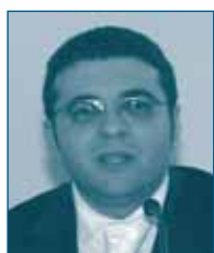
Г-н Эрмаль НАЗИФИ Албанское Конкурентное Ведомство Албания