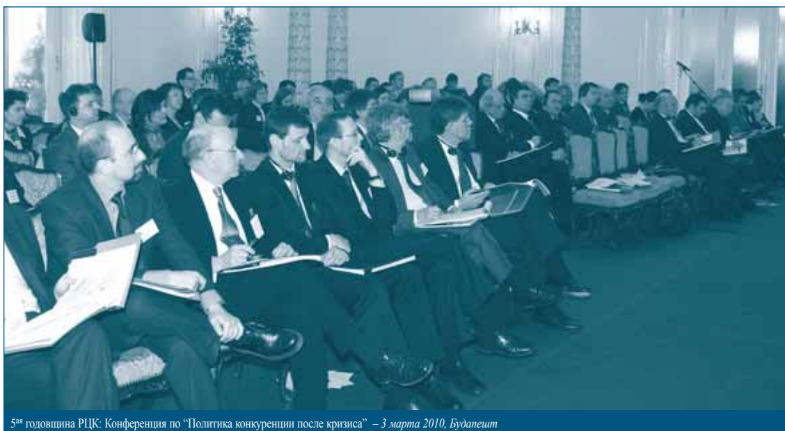
5 ая годовщина РЦК. Конференция по “Политика конкуренции после кризиса” – 3 марта 2010, Будапешт