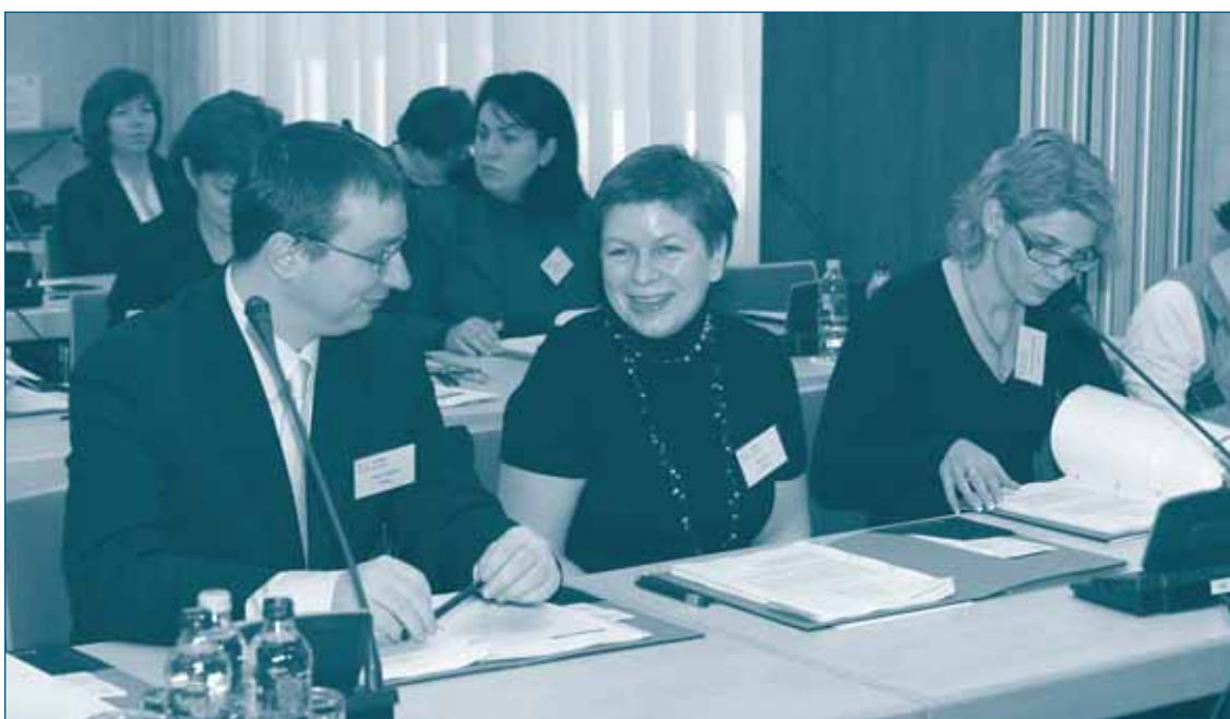
Семинар по Европейскому Конкурентному Праву для Судей Конкурентного Права – 12-13 февраля 2010, Будапешт