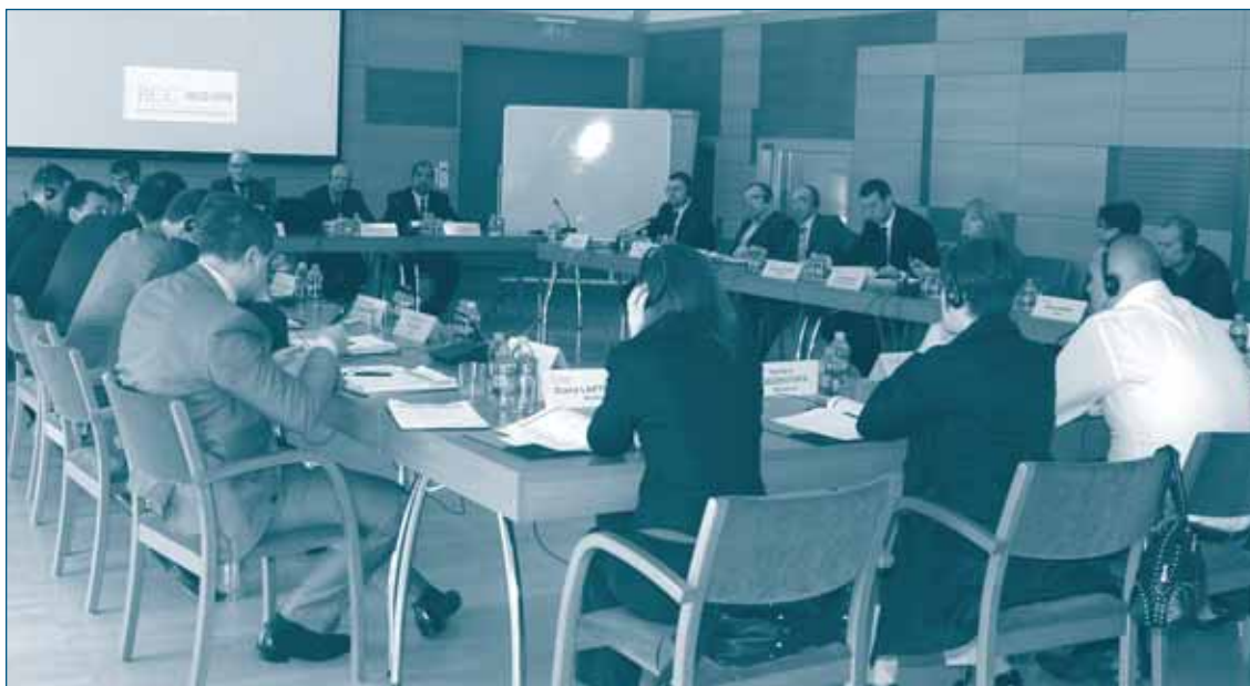
Семинар по злоупотреблению доминирующим положением – 10-13 мая 2010, Будапешт