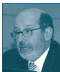
Г-н Мануэль СЕБАСТЬЯО Португальское Конкурентное Ведомство Португалия