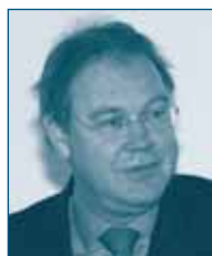
Г-н Аарт ДЭ ГЕУС Заместитель Генерального секретаря ОЭСР