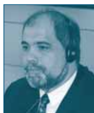
Г-н Гэри Х. ЩЁРР Федеральная Комиссия по Торговле США