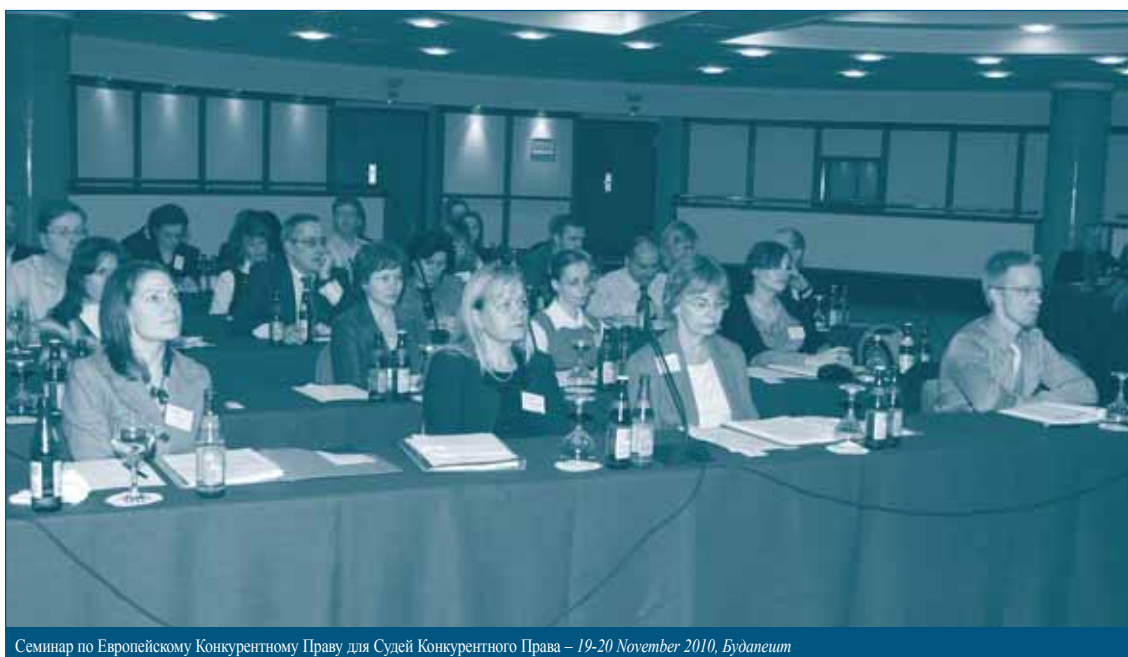
Семинар по Европейскому Конкуренционному Праву для Судей Конкуренционного Права – 19-20 November 2010, Будапешт