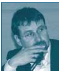
Г-н Тибор САНТО Совет по Конкуренции Венгерское Конкурентное Ведомство