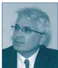
Г-н Петко НИКОЛОВ Конкурентное Ведомство Болгарии Болгария