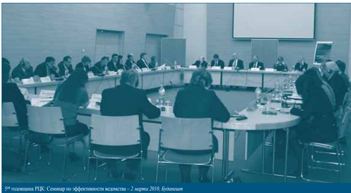
5 ая годовщина РЦК. Семинар по эффективности ведомства – 2 марта 2010, Будапешт

Особенностью данного мероприятия явился обмен специализирующимися в данной сфере сотрудниками равного уровня между Региональным центром по конкуренции ОЭСР – Конкурентного ведомства Венгрии в Будапеште (Венгрия) и Центром политики ОЭСР - Корея. Это способствовало взаимному обмену и обогащению