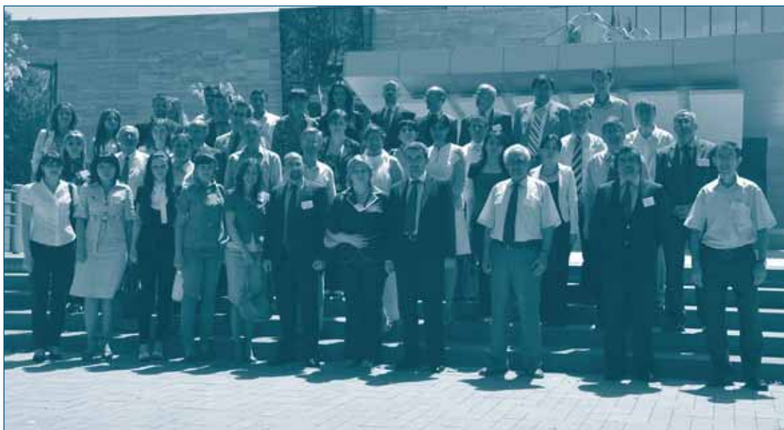
Семинар по вводным концепциям конкурентной политики – 29 июня-1 июля 2010, Ереван, Армения

Первая часть была посвящена роли, деятельности и достижениям РКЦ на региональном уровне. Петер Балаш, на тот момент министр иностранных дел Венгрии, прочитал лекцию о роли сотрудничества в Восточной и Юго-Восточной Европе. Он отметил, что Европейский Союз может оказать поддержку стабилизации в данном регионе, в том числе, посредством обмена опытом и обучения и повышения профессиональной подготовки сотрудников ведомств данных стран. Виорика Караре, Генеральный директор Конкурентного ведомства