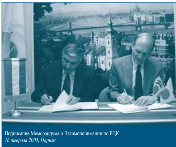
Подписание Меморандума о Взаимопонимании по РЦК 16 февраля 2005, Париж

Региональный центр по конкуренции ОЭСР – Венгрия в Будапеште (РЦК) был создан Организацией экономического сотрудничества и развития (ОЭСР) и Венгерским конкурентным ведомством (ВКВ – по-венгерски Gazdasági Versenyhivatal ) 16 февраля 2005 года, когда сторонами был подписан Меморандум о взаимопонимании. Главная задача РЦК состоит в том, чтобы содействовать развитию политики поддержки конкуренции, конкурентного права и культуры конкуренции в Восточной, Юго-Восточной и Центральной Европе, тем самым способствуя экономическому росту и процветанию в этом регионе.