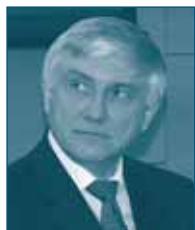
Г-н Золтан НАДИ Венгерское Конкурентное Ведомство Венгрия