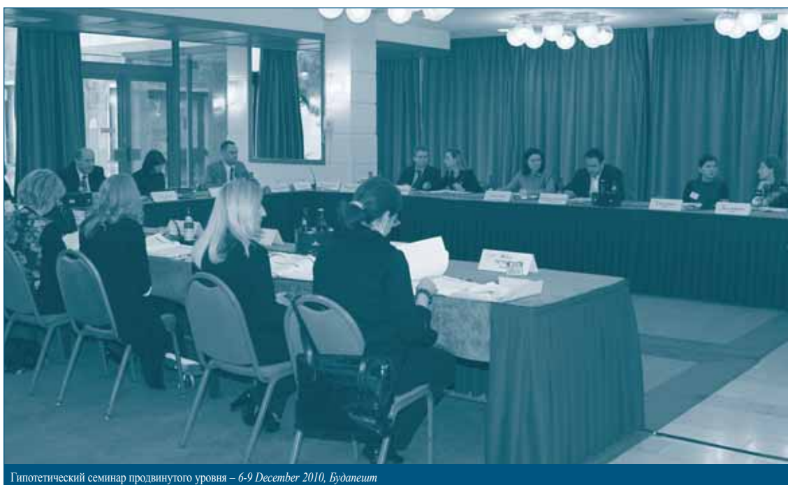
Гипотетический семинар продвинутого уровня – 6-9 December 2010, Будапешт

Семинар был посвящен исключительно законодательству о государственной помощи. В первый день семинара все утреннее заседание и частично вторая половина дня были отведены объяснению участникам семинара общих правил и концепций, применяемых в законодательстве о государственной помощи. Внимание было уделено как процедурным и институциональным вопросам, так и материальным нормам права. Система контроля за исполнением норм о государственной помощи достаточно сложна и отличается от общей системы применения норм конкурентного права. Выступающие уделили значительное время на семинаре, чтобы помочь судьям понять роль национальных судов в решении дел о государственной помощи и взаимоотношениям между частными исками и правореализацией со стороны Европейской Комиссии. Семинар имел сильную направленность на рассмотрение конкретных ситуаций: многие вопросы и проблемы, связанные с делами о государственной помощи, обсуждались сначала на секционных заседаниях, путем короткого анализа учебных дел, а затем на пленарном заседании были подведены итоги и даны разъяснения.