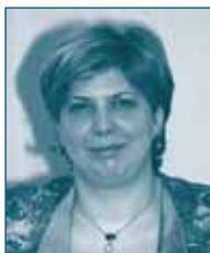
Г-жа Андреа БЕЛЕНИ Венгерское Конкурентное Ведомство Венгрия