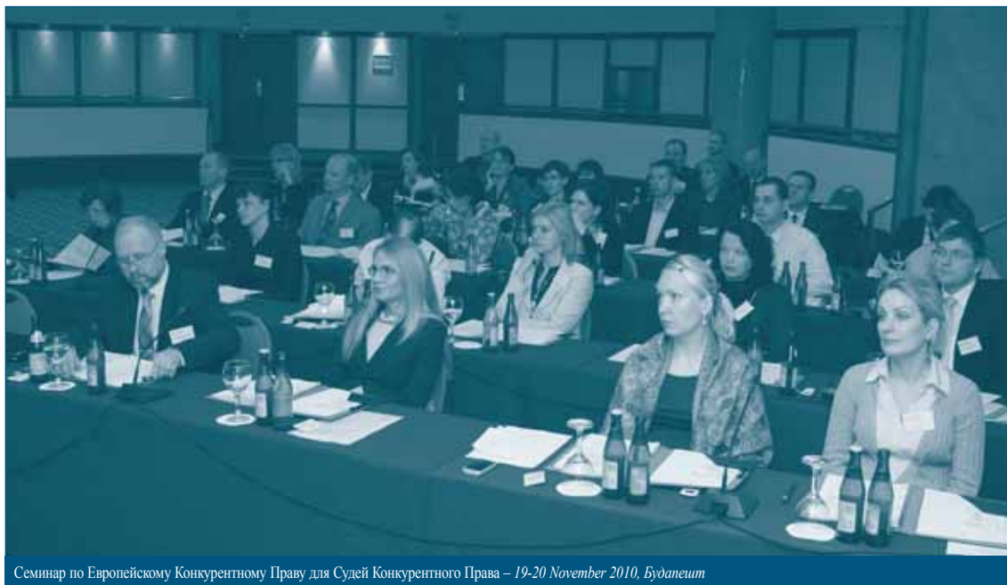
Семинар по Европейскому Конкурентному Праву для Судей Конкурентного Права – 19-20 November 2010, Будапешт

видов злоупотреблений. В его презентации основное внимание уделялось практическим трудностям, с которыми сталкиваются конкурентные ведомства при анализе таких злоупотреблений как хищническое поведение и ценовые скидки.