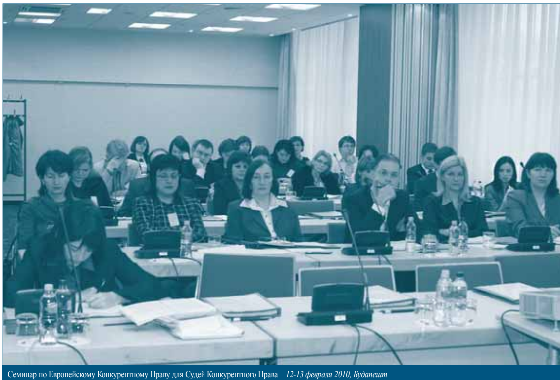
Семинар по Европейскому Конкурентному Праву для Судей Конкурентного Права – 12-13 февраля 2010, Будапешт

Более того, этим ведомствам время от времени приходится сталкиваться с рынками, которые имеют региональный охват, пересекаются или являются связанными друг с другом, а также иногда им приходится иметь дело с одним и тем же набором клиентов (одними и теми же компаниями из этого региона).