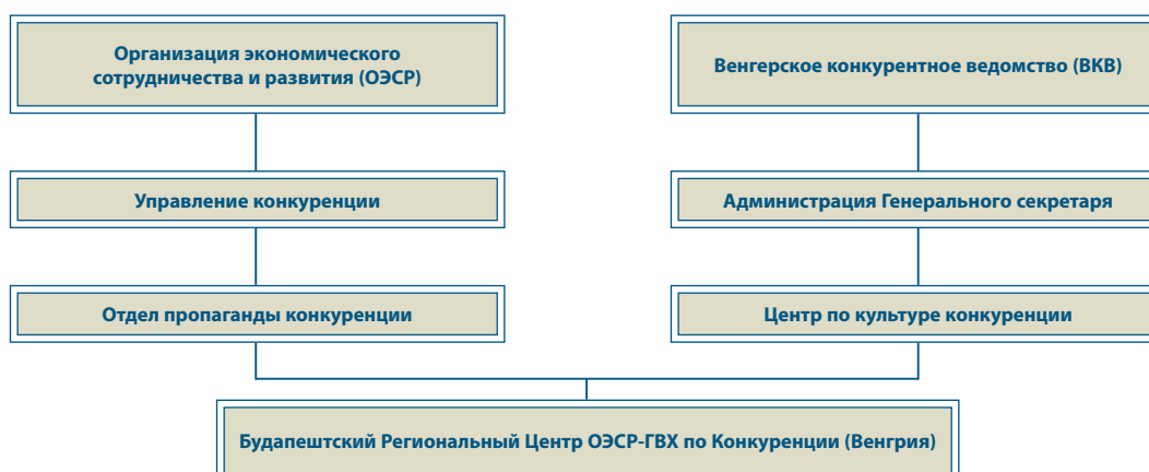
График №3: Органограмма РЦК