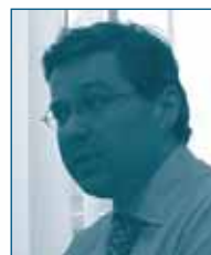
Г-н Дэйвид МЭЙР ГД SANCO Европейская Комиссия