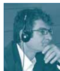
Г-н Мартин СТАНИСЛА Конкурентное Ведомство Франция