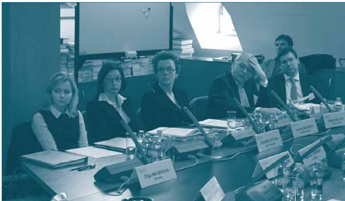
Семинар СЕСІ (ЦЕИК) Семинар по переходу в банковском секторе – 8-9 марта 2010, Будапешт

нию идеями и практическим опытом между двумя центрами; и при проведении соответствующих конкретных мероприятия была возможность задействовать взаимодополняющие сильные стороны данных сотрудников ОЭСР (один из которых экономист, а другой юрист).