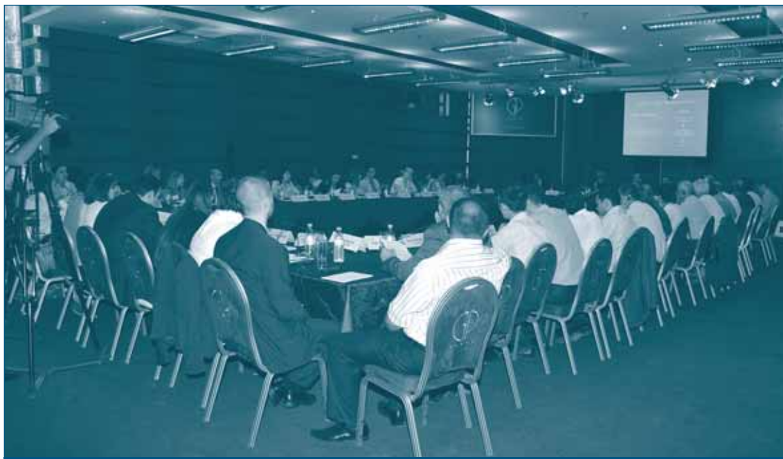
Семинар по вводным концепциям конкурентной политики – 29 июня-1 июля 2010, Ереван, Армения