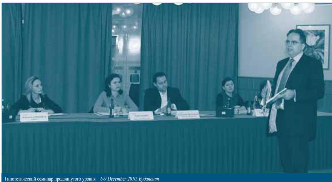
Гипотетический семинар продвинутого уровня – 6-9 December 2010, Будапешт