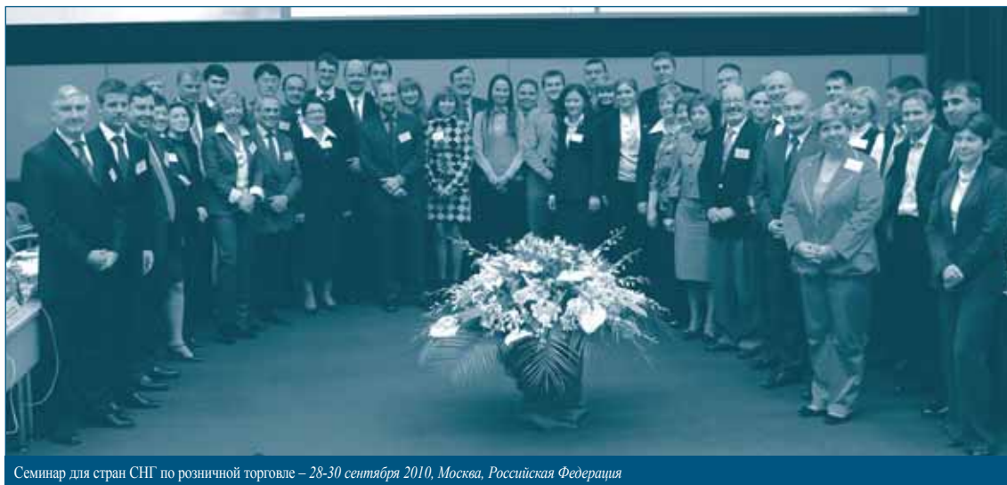
Семинар для стран СНГ по розничной торговле – 28-30 сентября 2010, Москва, Российская Федерация