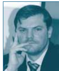
Г-н Френк МАЙЕР- РИГО Конкурентное Подразделение ОЭСР