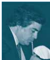
Г-н Мануэль КАБУГЕЙРА Португальское Конкурентное Ведомство Португалия