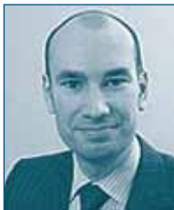
Г-н Арвид ФРЕДЕНБЕРГ Конкурентное Ведомство Швеции Швеция