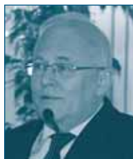
Г-н Петэр БАЛАШЬ Министр Иностранных Дел Венгрия