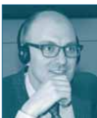
Г-н Николас ТЭЙЛОР Конкурентное Подразделение ОЭСР