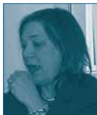
Г-жа Жденис ПАШАЛАРДО Федеральная Комиссия по Торговле США