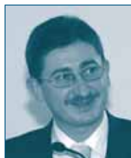
Г-н Богдан Мариус ЧИРИТОЮ Совет по Конкуренции Румынии Румыния