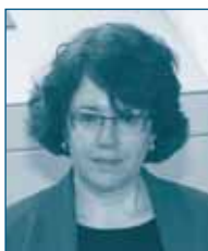
Г-жа Патрисия БРИНК Министерство Юстиции, Антитрестовское подразделение США