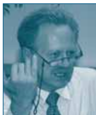
Г-н Райнер КАЛЬТЕНБРУННЕР Bundeswettbewerbs- behörde Австрия