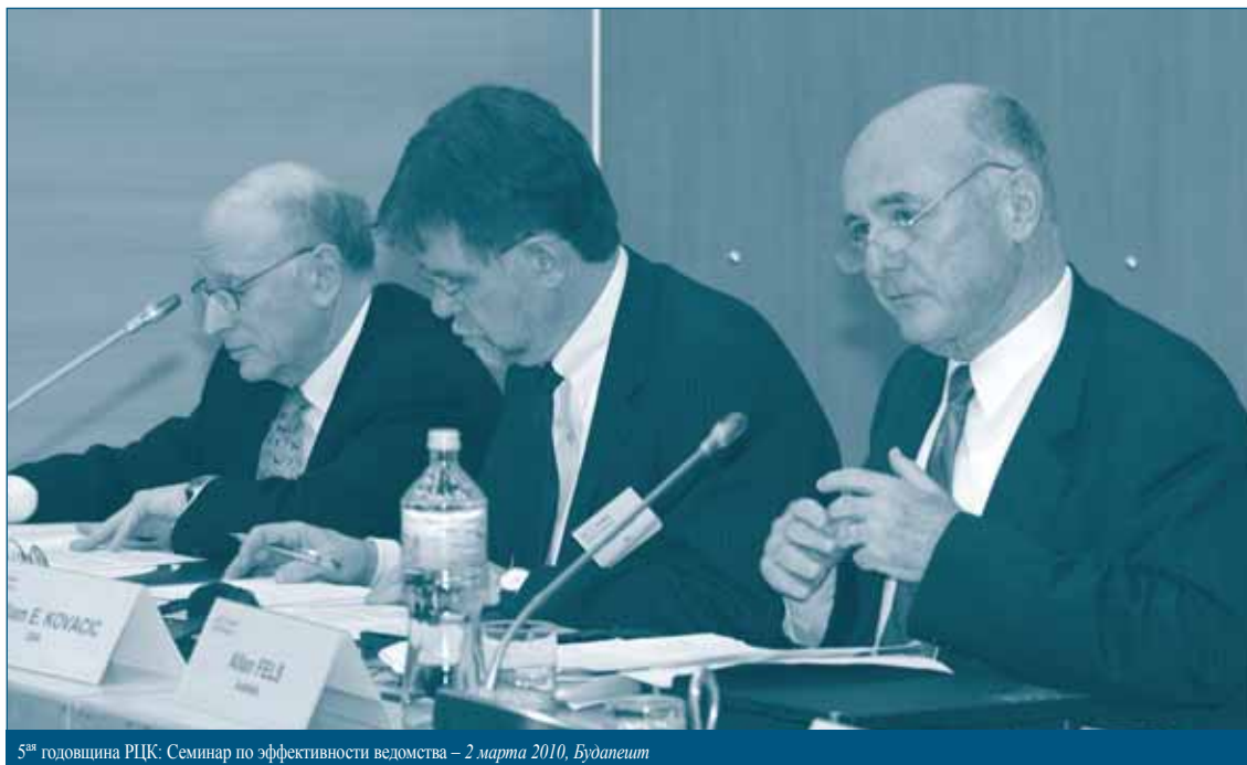
5 th годовщина РЦК: Семинар по эффективности ведомства – 2 марта 2010, Будапешт