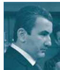
Г-н Артак ШАБОЯН Государственная Комиссия по защите экономической конку- ренции, Армения