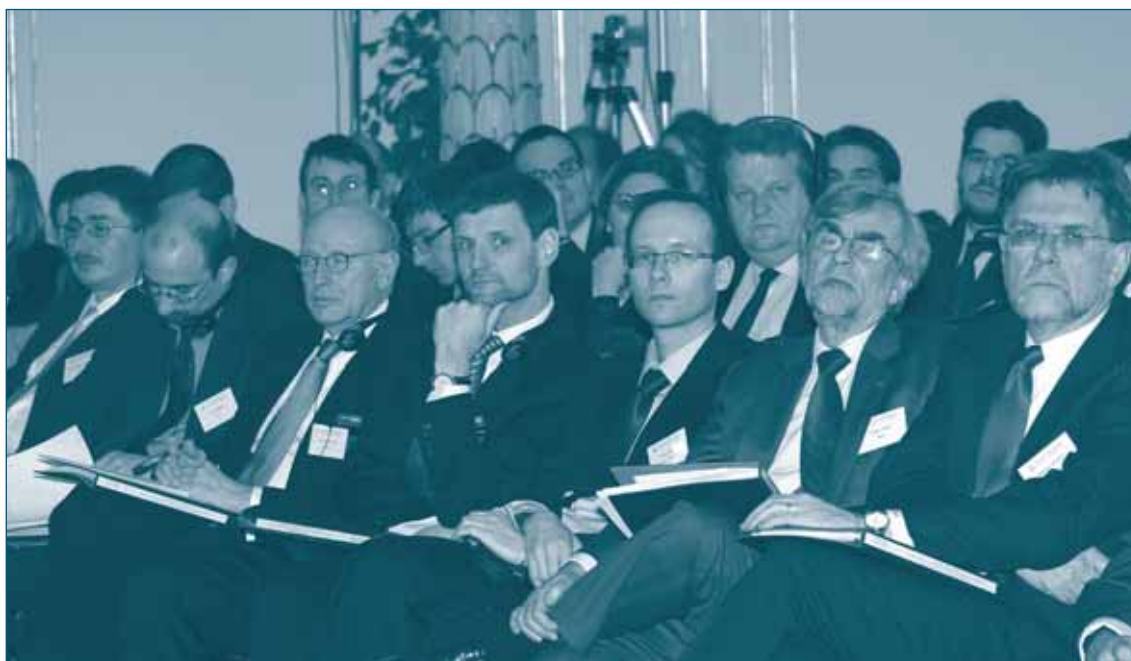
5 ая годовщина РЦК: Конференция по "Политике конкуренции после кризиса" – 3 марта 2010, Будапешт